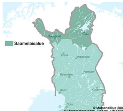
Kuva 2: Vrt. Saamelaisten kotiseutualue Suomessa.

Ratifiointiesityksessä todetaan, että saamelaisasutus on pitkään keskittynyt saamelaisten kotiseutualueelle , vaikka aikaisemmin on todettu, että vain 35 % saamelaisista asuu kotiseutualueella. Ratifiointiesityksessä