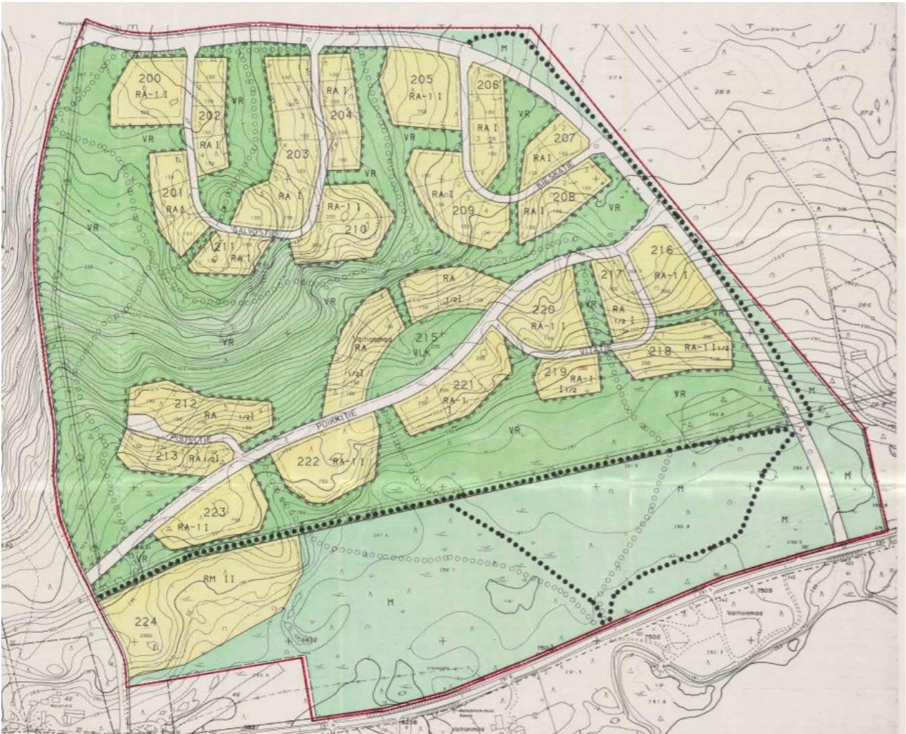
Voimassa oleva Jyppyrän rakennuskaavakartta.

Suunnittelualueella on voimassa 14.5.1993 vahvistettu Jyppyrän rakennuskaava. Paljasseläntien osalta ei ole voimassa olevaa asemakaavaa.